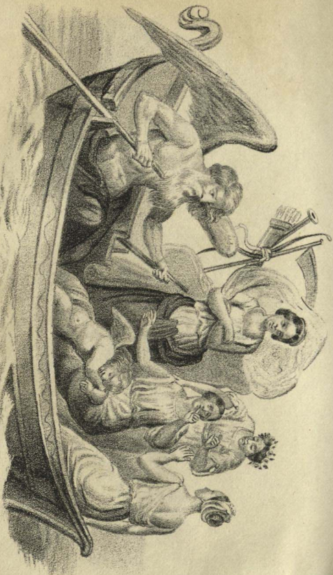
La barca del amor.