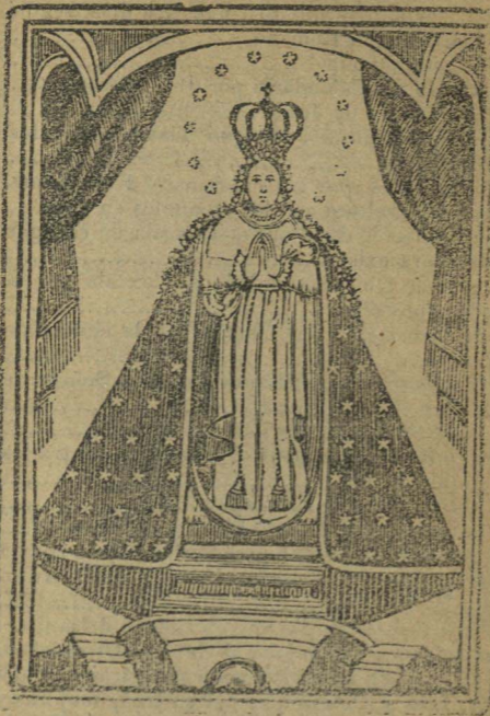
Ntra. Sra. de Ocotlán.