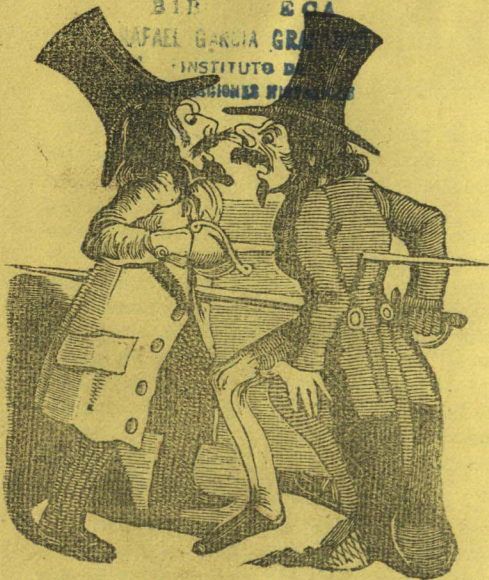
La razon de un duelo.

BIP ESCA RAFAEL GARCIA GRA INSTITUTO DE INVESTIGACIONES HISTORICAS